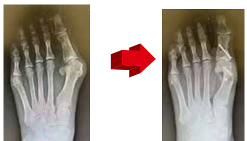
Long chevron + Akin